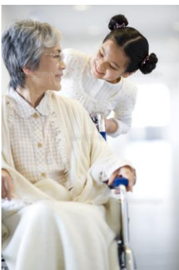
ホームケア事業部

より新しく、確かな製品をモットーに、 出産・子育てから介護まで、3つの事業部から、人生をトータル的にサポートします