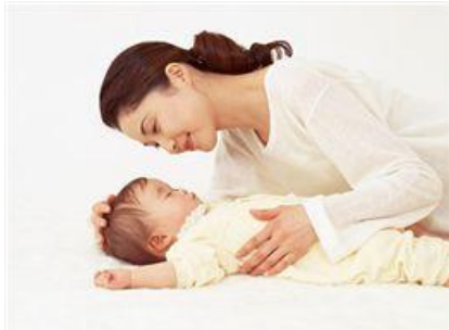
ホスピタル事業部